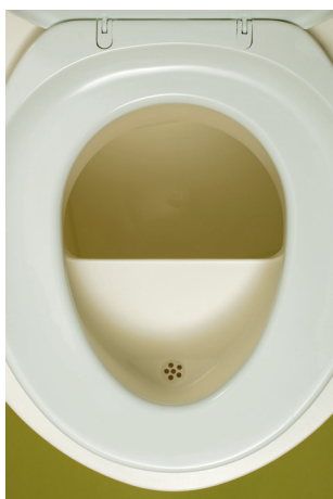
TORP-Trenntoilette in weiß