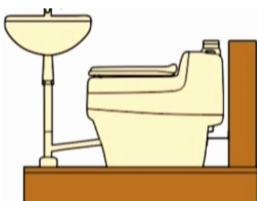
Urinableitung (Alternative 1)